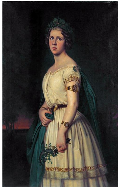
Giuditta Pasta, som Norma skrevs för. Jenny Lind som Norma

Bellinis opera Norma är juvelen i den italienska bel canto-traditionen och arian Casta Diva har blivit ikonisk genom bland andra Maria Callas. Den lyriska musiken skildrar handlingen i de långa bågarna och växlar mellan pompöst övermod, avgrund och storslagenhet. Det Medevaliknande triangeldramat utspelar sig mot en bakgrund av ett ockuperat land i krig, och böljar mellan situationer av värme, förtvivlan, ilska och klarhet.